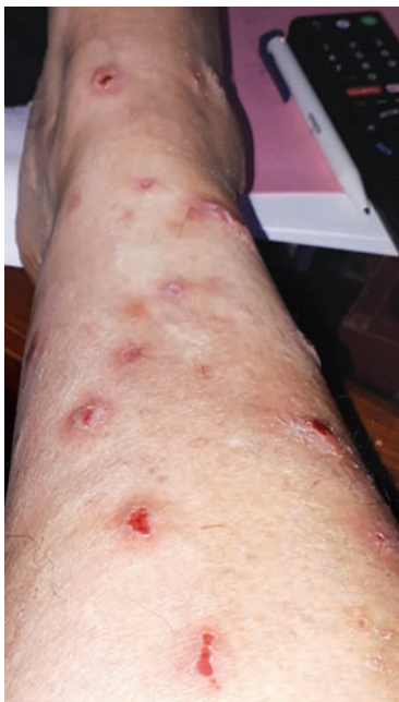
Figure 2. Lésions de prurigo nodulaire avant traitement (jambe).