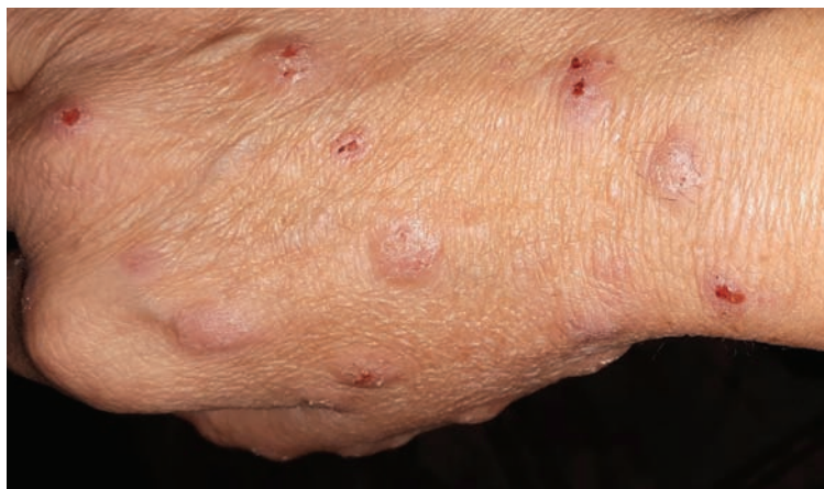
Figure 1. Lésions de prurigo nodulaire avant traitement (avant-bras et main).

Atteint de prurigo nodulaire depuis 10 ans, mais clairement diagnostiqué depuis seulement 1 an, mes conditions de vie deviennent de plus en plus difficiles. Les premiers boutons ont été fortuitement constatés en 2008 par un ophtalmologue après une opération de la cornée (kératite de Thygeson). En 2013, j'ai été hospitalisé pour un érysipèle associé à des lésions de grattage sur tout le corps. Malgré les premiers examens, aucun diagnostic formel n'avait été posé, et le traitement prescrit, dans mon cas, n'avait eu à peu près aucun effet. Je me suis familiarisé, par la suite, au fil des années aux grosses doses de dermocorticoïdes, d'antihistaminiques, aux séances d'UV et d'émollients en tout genre. Sans réponse obtenue avec ces traitements, d'autres ont été tentés pour diminuer le prurit : Quitaxon, anxiolytiques, Apaisyl et gabapentine, cette dernière étant un peu efficace mais n'empêchant pas les crises. Ayant aussi une lymphopénie CD4 profonde et idiopathique, je n'ai pas eu les traitements à base d'immunosuppresseurs type Protopic ou ciclosporine, mais des perfusions d'immunoglobulines (Clairyq) m'ont été bénéfiques lors des crises. Ma vie familiale et professionnelle est profondément affectée par cette maladie très invalidante, les crises pouvant durer de 3 à 6 mois sur la période de novembre à juin.